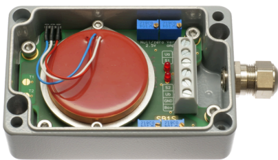
Sensorbox mit einem Sensor, einem Spannungsnormierverstärker mit 0,5 ... 4,5 Volt Signalausgang und zwei Open-Kollektor-Schaltausgängen